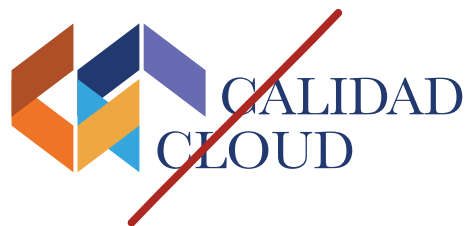
Cambiar tipografías institucionales