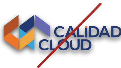
Agregar sombras o efectos