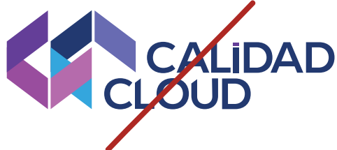
Colores no institucionales

Se dan a conocer algunos usos incorrectos con el fin de mantener íntegra y sin alteraciones la identidad corporativa de Calidad Cloud.