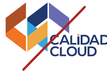
Cambiar la proporción y tamaño de los elementos