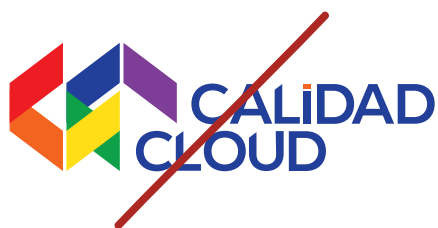
Cambiar los colores institucionales