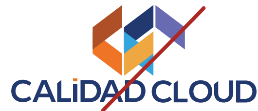
Cambiar los elementos de lugar